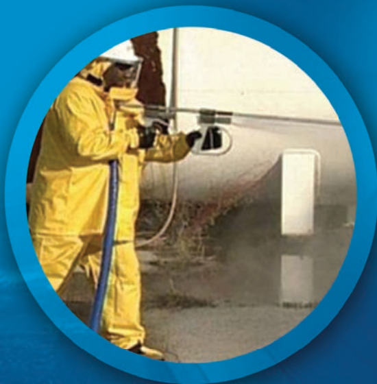
Hidroblast (Frío/Caliente) Limpieza Química Cold or Hot Hydroblast – Chemical Cleaning

En CIGOL contamos con los siguientes sistemas de limpieza: